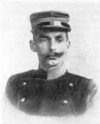
Oberst Christian Iselin, einer der ersten militärischen Skipioniere und Initiant zur Gründung des Schweizerischen Skiverbandes im Jahre 1904.

1948: St. Moritz. V. Olympische Winterspiele: Patrouillenlauf mit Schießen als Rahmenwettbewerb. Distanz zirka 28 km. Start auf Corviglia, Ziel im Skistadion im Bad St. Moritz. 1. Schweiz (Oblt. Zurbriggen, Wm. Zurbriggen, Gfr. Andenmatten, Gfr. Vouardoux) in 2:34:25; 2. Finnland 2:37:23; 3. Schweden; 4. Italien; 5. Frankreich; 6. Tschechoslowakei; 7. USA. Während die Finnen für ihr ausgezeichnetes Schießen 9 Min. Gutschrift erhielten, erzielten die Schweizer nur 5 Min. Bonifikation, stellten aber den Sieg durch eine