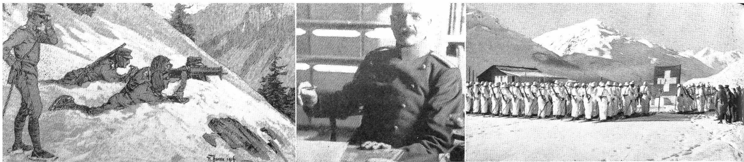
Bild links: Einsatz unserer Gebirgstruppen, einer Mg-Gruppe über dem Tal, als der Ski noch nicht verbreitet war und jede Bewegung im Winter mit den Schneereifen mühsam erkämpft werden mußte.

Bild Mitte: Oberst i. Gst. Egli, Unterstabschef der Eidgenössischen Armee, Erster Vorsitzender der Militärdelegation des Schweizerischen Skiverbandes.