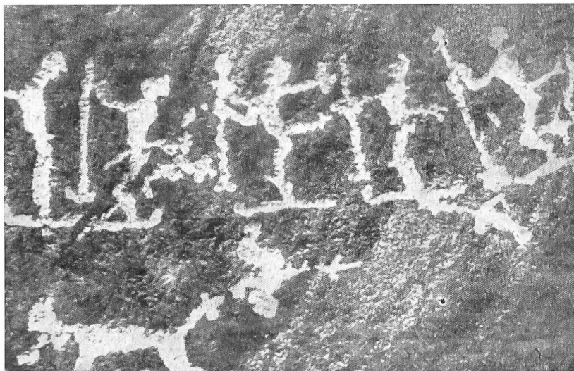
Aufsehenerregende Felszeichnungen am Weißen Meer: Die ersten Bilder von Skiläufern! Auf dem steinigen Boden einer öden, sturmgepeitschten Felseninsel am Weißen Meer entdeckten Forscher 4000 Jahre alte Bilder: die erste Darstellung von Skifahrern, die es auf Erden gibt. Die Bilder beweisen, daß die Skier in Europa auf eine eiszeitnahe Geschichte zurückblicken können. Sie zeigen aber auch die Dämonenjucht, die die ersten Skiläufer beherrschte. Der Zeichner hat seine Gruppe von Treibern mit Tierschwänzen dargestellt: selbst wie Tiere aussehend, sollten sie das Wild an sich locken! Die Zeichnung selbst erfolgte nicht etwa aus künstlerischen Beweggründen, sondern aus magischen. Mit der Dargestellung der Jagd glaubte der Mensch der Vorzeit, das in diesen Regionen von Hunger und Eis so heißbegehrte Tier in seine Hände zu zaubern.

Aus den Berichten dieser Militärdelegation, die jeweils im «Ski», dem Jahrbuch des Schweizerischen Skiverbandes, erschien, möchten wir den Militärskillauf des Jahres 1912 erwähnen, der von Hospenthal aus über den Gotthard- und Sellapaß durchs Unteralperts nach Andermatt führte. Eine beachtliche Strecke von 26 km mit 1200 m Steigung. Die Siegerpatrouille, gestellt von der Fortwache in Andermatt, bewältigte