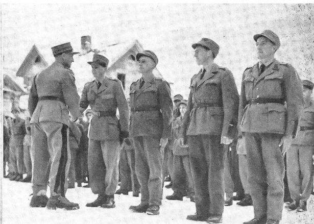
Patrouillenlauf der 8. Division in Engelberg.