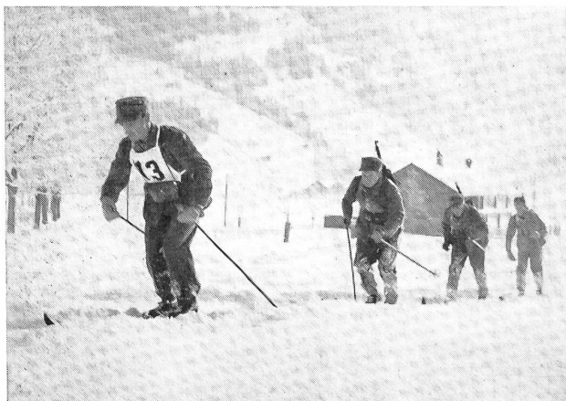
Patrouillenlauf der Geb.-Brig. 11 in der Lenk.

Durch eine erfreuliche Neuordnung der Gruppe für Ausbildung im EMD können nun auch die finanziellen Probleme unserer Patrouilleure besser geregelt werden. Die oft angeführte mangelnde Unterstützung der Patrouillenläufe durch die Armee ist heute kein Grund mehr, der zur Entschul-