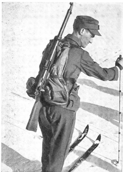
Das ist die Packung unserer Patrouilleure von 8 kg Gewicht, die unterwegs sehr anhänglich werden kann und von guten Patrouilleführern unterwegs im Wechsel abgenommen wird.

digung mangelhafter Beteiligung an den Ausscheidungen der Heeresseinheiten ins Feld geführt werden kann. Durch den erwähnten Erlaß werden nun den Patrouilleuren die Reiseauslagen zurückerstattet, und die Heeresseinheiten erhalten für jeden Wettkampfteilnehmer eine Entschädigung für Unterkunft und Verpflegung. Die Militärdirektionen einzelner Kantonsregierungen bekunden ihr Interesse und die Anerkennung dieses Einsatzes durch finanzielle Beiträge an die aus ihrem Kanton stammenden Truppenkörper, die mithelfen, daß die Heeresseinheiten die finanziellen Probleme des außerdienstlichen Einsatzes besser lösen können. Diesen verständnisvollen Militärdirektoren gilt auch hier unser ganz besonderer Dank.