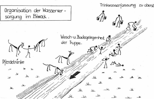
Organisation der Wasserversorgung im Biwak.