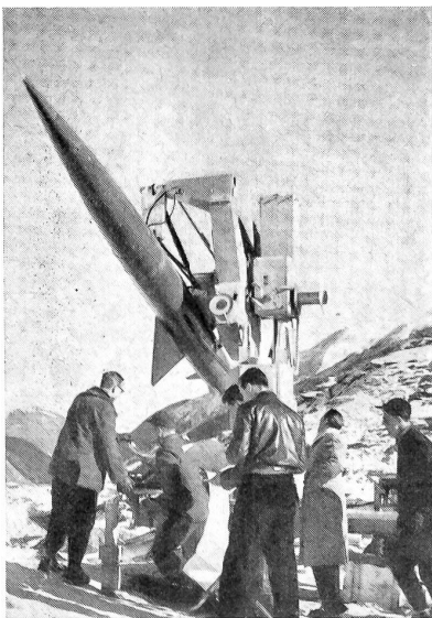
Fernlenk-Raketen-Schießversuche im Gebirge

Auf Grund der eingangs erwähnten Feststellungen soll nicht verschwiegen werden und sei im besonderen darauf hingewiesen, daß gerade für einen Kleinstaat solche Fernlenk-Raketen für die nächste Zukunft wohl das einzige für unsere Verhältnisse noch einigermaßen erschwingliche und erfolgversprechende Verteidigungsmittel unserer Städte und Industriezentren gegen allfällige Angriffe aus der Luft darstellen.