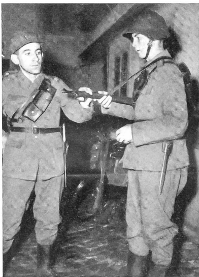
Aus einer Radfahrer-Rekrutenschule «Wie geht's?» Fürsorglich erkundigt sich der Gruppenführer nach dem Zustand seiner Leute und ihrer Ausrüstung.

Suisse nennt. Hindernisse besonderer Art stellen sich hier den Rekruten in den Weg: Gemächlich ziehen größere und kleinere Kuhherden auf die Weideplätze zu Füßen des Gonzen und Alvier hinaus. Nach Sargans wird der Wind zum willkommenen Verbündeten und stößt die allmählich ermüdeten «Giganten im feldgrauen Dreß» gegen Landquart hinauf, ans Tor des Prättigaus. Noch 30 Kilometer und 700 Meter Höhendifferenz sind zu überwinden. Fast bricht die Sonne durch die gelichtete Wolkendecke. In forschem Tempo eilen die Fahrer nach aufwärts. Doch bleibt der gefürchtete Stich zwischen Küblis und Saas. Die «Bergspezialisten» wetzen ihre Klingen. Dann heißt's aber bald einmal für alle absitzen und «rudern». Gnädig bleibt jetzt die Sonne versteckt. Die Kompanien haben sich wieder gut formiert und fahren mit viertelstündigem Vorsprung auf die Marschtabelle durchs «Etappenziel». Die Rekruten haben die erste große Probe bestanden.