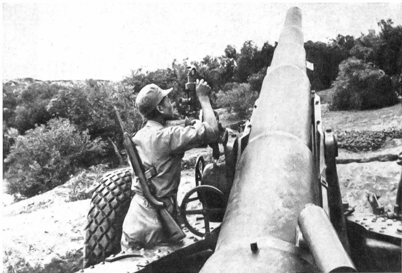
Die feindlichen chinesischen Brüder:

Erbittertes Artillerieduell auf der Insel Quemoy.