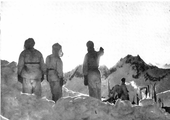
Sonnenuntergang beim Schneebiwak auf dem Wittenwasser-Paß (2840 m). Blick gegen die Saashörner und die Berner Oberländer Berge