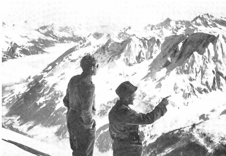
Aussicht vom Pizzo di Pesciora (3123 m). Rechts Campo Lungo und Campo Tencia. Unten das Bedrettotol und unter der Nebelschicht die obere Leventina