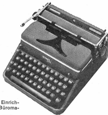
Hermes 2000 die Luxusportable mit den Einrichtungen einer modernen Büromaschine Fr. 470.-

Paillard SA. mit Werken in Yverdon und Ste-Croix ist seit 140 Jahren weltbekannt für ihre Leistungen auf dem Gebiet der Präzisionsmechanik. Die von ihr entwickelten HERMES-Schreibmaschinen tragen das Kennzeichen bester schweizerischer Qualitätsarbeit.