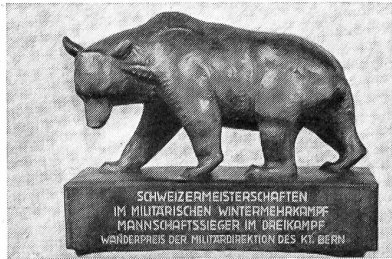
Der originelle Wanderpreis der Berner Militärdirektion, der dieses Jahr vom gegenwärtigen Besitzer, den Grenzwächtern, hart verteidigt werden dürfte.