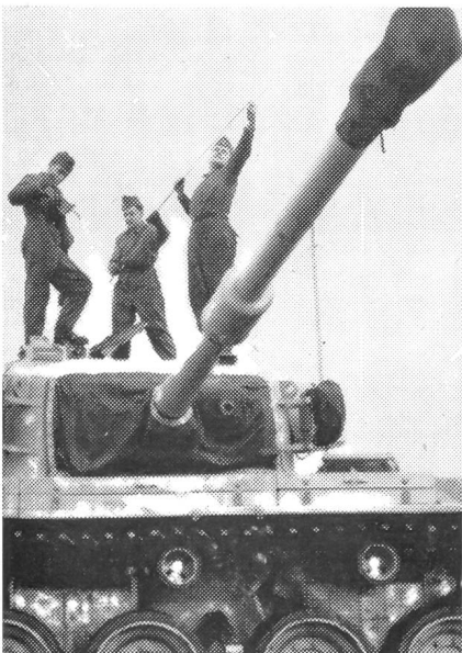
Die Funkantenne wird ausgefahren. Während der Fahrt muß jeder Centurion mit den anderen und dem Kommandanten in enger Funkverbindung bleiben. Schweizerische Funkgeräte sind in den englischen Centurion eingebaut worden.