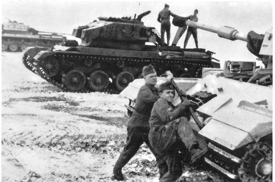
Besonderer Pflege bedürfen nach jeder Ausfahrt die Raupen. Größte Sorgfalt und Sauberkeit sind notwendig, um die kostspieligen Fahrzeuge immer in bestem Zustand zu erhalten.