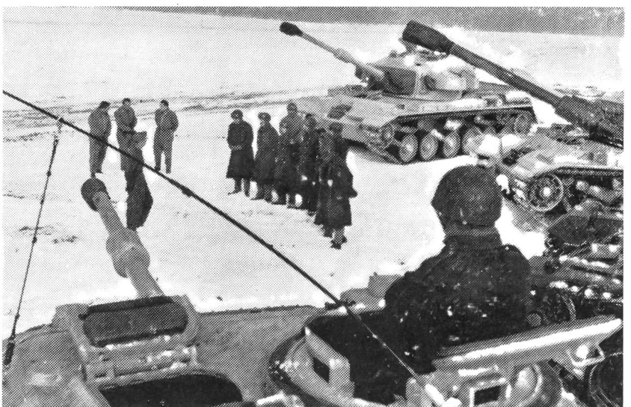
Eine erste Manöverkritik der schweizerischen Centurion-Panzer auf der Thuner Allmend. Der Einsatz mittlerer Panzerwagen bringt besondere Probleme mit sich, die gründlich besprochen werden müssen.