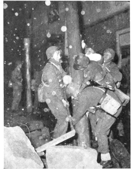
Die größte Luftschutzübung seit Kriegsende. In St. Gallen fand eine kombinierte Zivilschutzübung statt, an der 800 Angehörige der Armee und über 1300 Zivilpersonen teilnahmen.

Weil mit dem Hauptverlesen auch die Tagesarbeit abgeschlossen wird, mag ein kurzer Ausblick auf Kommendes die notwendige geistige Einstellung schaffen, die zum Gelingen Voraussetzung ist. Nur das darf dieser Ausblick sein und nie Rechtfertigung von oder quasi Entschuldigung für kommende Strapazen. Das Hauptverlesen ist nicht der Ort für lange Ausführ-