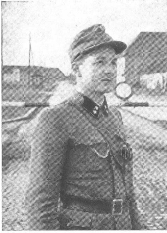
Typ eines jungen Unteroffiziers des Bundesheeres, der Wachtkommandant der Panzerschule von Hörsching.