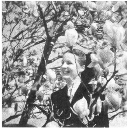
Blütenwunder des Tessiner Frühlings.

Anders geartete Menschen bringt die karge, nur durch zähen Fleiß einigermaßen nutzbare Erde der vier Locarner Bergtäler Val Verzasca, Valle Maggia, Valle Onsernone und Centovalli hervor. Da industrielle Arbeitsmöglichkeiten beinahe gänzlich fehlen, ist die Bevölkerung auf den Ertrag ihrer bergbäuerlichen Arbeit angewiesen; Landwirtschaft und Viehzucht sind die Nährquellen vom untersten Dorf bis dort hinauf, wo den kurzen, überaus arbeitsreichen Sommern ein langer, strenger Winter folgt. Verfehlt wäre jedoch die Annahme, daß überall in diesen abgelegenen Tälern die Armut ihr hartes Regime führe und jeden Talgenossen unter ihre Fuchtel zwingt. Oft ist ein friedlicher, ja, behäbiger Wohlstand vorhanden als Entgelt für den nie unterbrochenen Mühewalt mit den Kühen, Ziegen und Schafen. Aber zu schweigsamer Nachdenklichkeit hat die geistige Natur im Verein mit der Abgeschlossenheit und Einsamkeit die Menschen er-