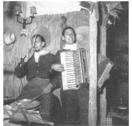
Die alten Tessiner Weisen und Klänge, wie sie unserem Sonnenkanton eigen sind, dürften auch manchem SUT-Besucher noch lange nachklingen.

Das Schloß in Locarno, dessen Mauern einst vom Lago Maggiore umspült wurden, wie es Ende des 14. Jahrhunderts aussah, nach einer zeichnerischen Rekonstruktion.