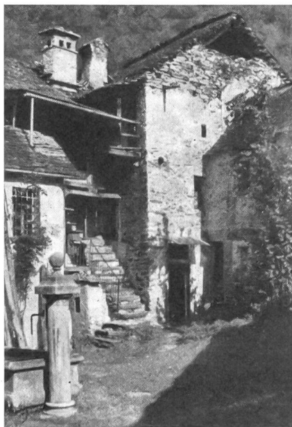
Die stille Einkehr und Beschaulichkeit, wie sie in ihrer unverdorbenen Vielfalt in den Tälern des Tessins noch angetroffen wird, laden immer wieder zum Verweilen ein. Ein Bild aus dem Maggiatal.

Locarno mit seinen Ufern und Bergen liegt hingebungsvoll dem Süden zugewandt. Hier genießt der Mensch die längste Sonnenscheindauer der ganzen Schweiz, und das südliche Klima begünstigt eine Vegetation wie sonst nur noch an den Mittelmeerküsten. Ohne besondere Schutzvorkehrungen reifen in den Gärten die Orange und die Zitrone, auch der Feigenbaum ist häufig und schenkt seine Früchte, und an sonnenwarmen Mauern entfalten Agaven ihre langen Schwerter oder dräuen Kakteen mit ihren stacheligen Spachteln.