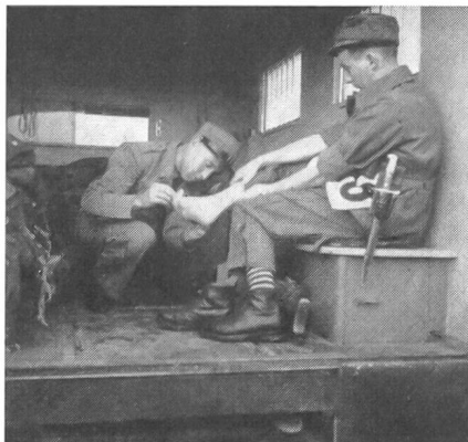
Am Waffenlauf ist mancher froh um das fahrende Krankenzimmer des MSV im Ambulanzwagen.

Die Präsidentin des Verbandes schweizerischer Militärfahrerinnen meldet sich zum Wort und führt aus: «Auch unser Verband setzt sich die gleichen Ziele, wie sie mein Vorredner schilderte. Unsere Arbeit aber ist zweierlei, und zwar sehr verschiedener Art. Wir müssen den Gang des Motors kennen, Pannen beheben können, Parkdienst leisten, in jedem Gelände und bei jeder Witterung sichere Fahrerinnen sein, Arbeiten, die nicht ohne weiteres der Frau gegeben sind und deshalb ständiges Ueben bedingen. Wir müssen uns auch in unbekanntem Gelände mit Karte und Kompaß zurecht finden können und uns nicht zuletzt in eine uns ungewohnte militärische Ordnung einfügen. Dann haben wir aber auch mit Verwundeten zu tun. Wir haben sie aufzunehmen, kürzere oder längere Zeit zu transportieren, sie manchmal zu pflegen und ihnen oft auch die erste Hilfe zu leisten. Und diese Aufgabe ist uns wesensnahe, denn welche Frau wäre nicht die erste, wenn es gilt Not zu lindern. Es ist uns deshalb ein inneres Bedürfnis, die erste Hilfeleistung an Verwundete zu beherrschen. Wir sind froh, daß vor kurzem der Schweizerische Militär-Sanitäts-Verein seine Statuten, nach denen bisher nur männliche Angehörige der Armee Mitglieder sein konnten, in dem Sinne abgeändert hat, daß nun auch FHD mitarbeiten können.» Hier