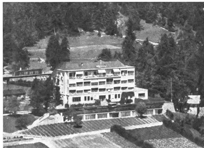
Clinique Militaire Montana.

Das zweite grundlegende Problem ist der sachliche Umfang der Versicherung, die Frage, nach welchen Grundsätzen die MV haftet. Hier unterscheidet das Gesetz nach dienstlichen, vordienstlichen und nachdienstlichen Gesundheitsschäden. Das ist so zu verstehen: