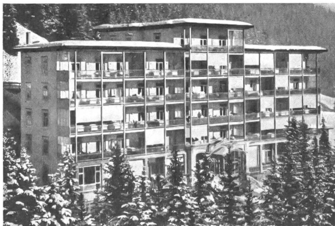
Eidg. Militärsanatorium Davos-Platz.

Im Rahmen dieses Aufsatzes können nun im weiteren nicht alle Bestimmungen des geltenden Gesetzes und ihre Auswirkungen in der Praxis erläutert und dargestellt werden. Es gilt, sich auf einige wenige grundsätzliche Probleme zu beschränken, wobei ich nicht unterlassen möchte, bei dieser Gelegenheit den Leser auf die kleine Broschüre zu verweisen, die der Bund Schweizer Militärpatienten vor wenigen Wochen herausgegeben hat. Diese trägt den Titel «Der Soldat schützt uns, wer schützt ihn?» und enthält in gedrängter Form unter anderem auch alles für den Militärpatienten Wissenswerte.