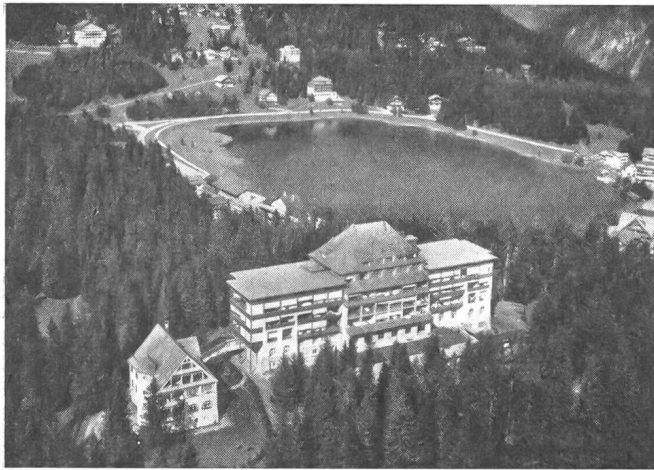
Eidg. Militärsanatorium Arosa.

1954 bei 2475 klagefähigen Verfügungen 171 Klagen bei den Versicherungsgerichten der Kantone eingereicht und 70 Entscheide erster Instanzen an das EVG weitergezogen.