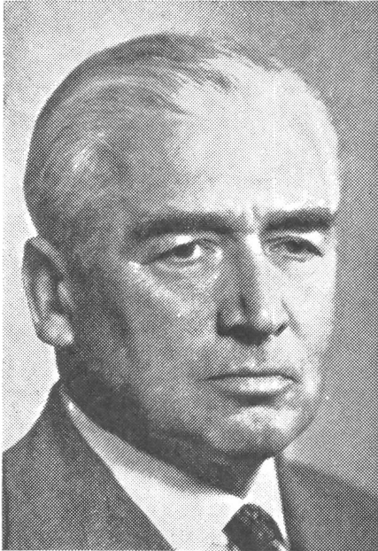
Oberstkorpskommandant Gübeli 70jährig. Am 28. Dezember beging in Luzern, wo er im Ruhestand lebt, der ehemalige Kommandant des 2. Armeekorps, Oberstkorpskommandant