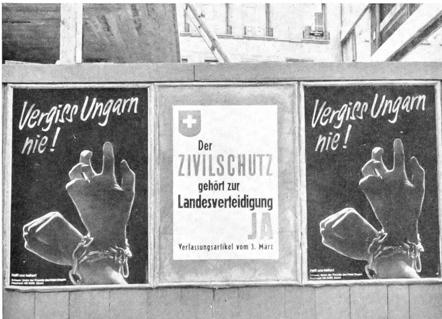
Eine Mahnung, die leider nicht verstanden wurde.