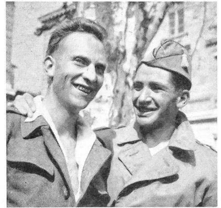
Gedenklauf Le Locle—Neuenburg: Die Sieger

Die japanische Wehrmacht besteht nur aus Freiwilligen. Es gibt 49 Werbestellen, die unter der Bevölkerung eine nachdrückliche militärische Propaganda entfalten. Besondere Aufmerksamkeit widmet man dem Offiziersnachwuchs. Von den gegenwärtig aktiven Offizieren sind bei der Armee 35,4%, bei der Marine 85,1% und bei der Luftwaffe 58,6% alte Offiziere, die schon den letzten Krieg mitgemacht haben. Viele Offiziere werden in den Vereinigten Staaten oder aber in den amerikanischen Militärlagern in Japan ausgebildet.