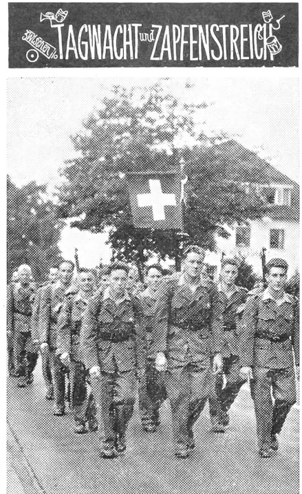
Die Schweiz am internationalen Viertagemarsch von Nijmegen.

Die Schrift wird vom Zentralsekretariat des SUOV in Biel zum Preis von Fr. 2.50 vertrieben. Sie ist auch in allen Buchhandlungen erhältlich. -th.