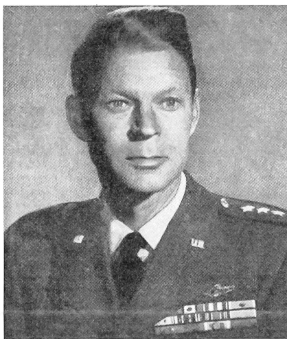
General Lauris Norstad, der neue Oberbefehlshaber der Nato

...ist Flieger von der Pike auf. Nach der Ausbildung in West-Point (1930) wurde er zwar zur Kavallerie kommandiert, wechselte aber schon nach wenigen Wochen zur Fliegerei über, diente viereinhalb Jahre in einer Jagdgruppe auf Hawaii, schulte auf mittleren Bombern und auf der «Flying Fortress» und setzte dann zu einer beispiellosen Laufbahn an: 1935 Leutnant, 1940 Hauptmann, 1942 Oberstleutnant, 1943 Brigadegeneral, 1948 Kommandierender General, 1952 — im Alter von 45 Jahren — Vier-Sterne-General. Im Tempo dieser Karriere spiegelt sich etwas von der rasanten Entwicklung seiner Waffe, aber sicher mehr noch die Begabung und die Leistung dieses Offiziers, von dem seine Jahrgangskameraden sagen, er sei eine Art «Präzisionsmaschine». Nennenswerte Frontkommandos hatte er nicht inne, um so gewichtiger aber war seine in jungen Jahren schon übernommene Verantwortung in hohen Stabsstellungen: mit 35 Jahren in den Beirat des Kommandierenden Generals der Luftwaffe in Washington berufen, im gleichen Jahr stellvertretender Stabschef für Operationen in der 12. US-Luftflotte, mit 36 Jahren Leiter der Operationsabteilung der alliierten Luftstreitkräfte im Mittelmeer, mit 37 Jahren Chef des Stabes der 20. Luftflotte, mit 39 Jahren Leiter der Abteilung Planung und Operationen im Kriegsministerium in Washington, mit 43 Jahren stellvertretender Stabschef der gesamten Luftstreitkräfte, im gleichen Jahr Oberbefehlshaber der US-Luftstreitkräfte in Europa, mit 44 Jahren