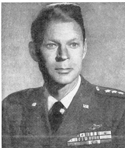
General Lauris Norstad, der neue Oberbefehlshaber der Nato

...ist Flieger von der Pike auf. Nach der Ausbildung in West-Point (1930) wurde er zwar zur Kavallerie kommandiert, wechselte aber schon nach wenigen Wochen zur Fliegerei über, diente viereinhalb Jahre in einer Jagdgruppe auf Hawaii, schulte auf mittleren Bombern und auf der «Flying Fortress» und setzte dann zu einer beispiellosen Laufbahn an: 1935 Leutnant, 1940 Hauptmann, 1942 Oberstleutnant, 1943 Brigadegeneral, 1948 Kommandierender General, 1952 — im Alter von 45 Jahren — Vier-Sterne-General. Im Tempo dieser Karriere spiegelt sich etwas von der rasanten Entwicklung seiner Waffe, aber sicher mehr noch die Begabung und die Leistung dieses Offiziers, von dem seine Jahrgangskameraden sagen, er sei eine Art «Präzisionsmaschine». Nennenswerte Frontkommandos hatte er nicht inne, um so gewichtiger aber war seine in jungen Jahren schon übernommene Verantwortung in hohen Stabsstellungen: mit 35 Jahren in den Beirat des Kommandierenden Generals der Luftwaffe in Washington berufen, im gleichen Jahr stellvertretender Stabschef für Operationen in der 12. US-Luftflotte, mit 36 Jahren Leiter der Operationsabteilung der alliierten Luftstreitkräfte im Mittelmeer, mit 37 Jahren Chef des Stabes der 20. Luftflotte, mit 39 Jahren Leiter der Abteilung Planung und Operationen im Kriegsministerium in Washington, mit 43 Jahren stellvertretender Stabschef der gesamten Luftstreitkräfte, im gleichen Jahr Oberbefehlshaber der US-Luftstreitkräfte in Europa, mit 44 Jahren