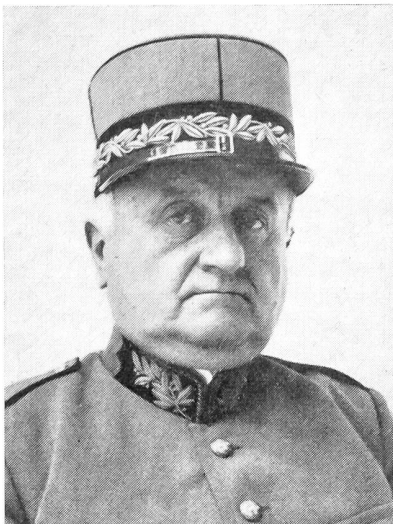
Eugen Bircher †