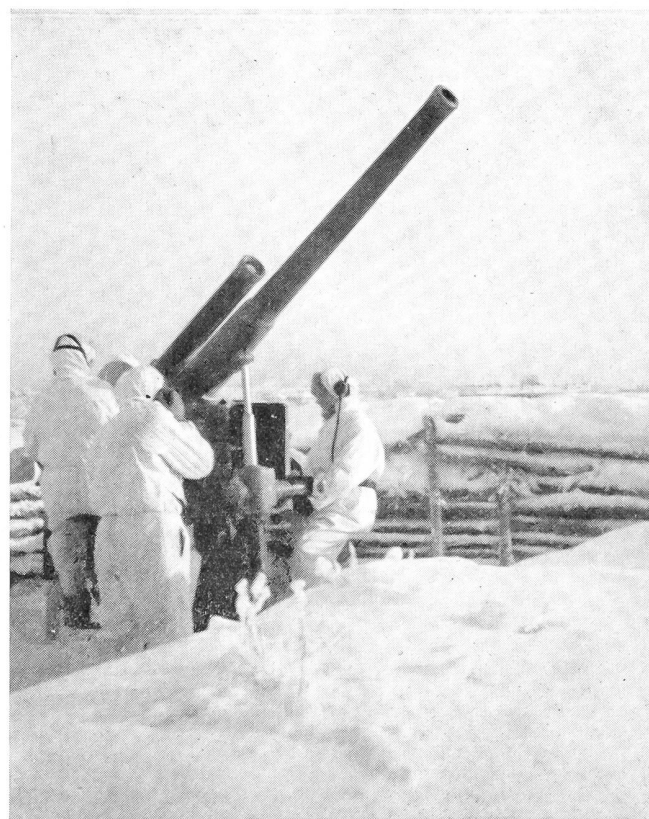
Die finnische Artillerie, die unter Marschall Mannerheim zu einer gefürchteten und präzis schießenden Waffe entwickelt wurde, wird auch in der heutigen Armee nicht vernachlässigt und in enger Zusammenarbeit mit der Infanterie geschult.