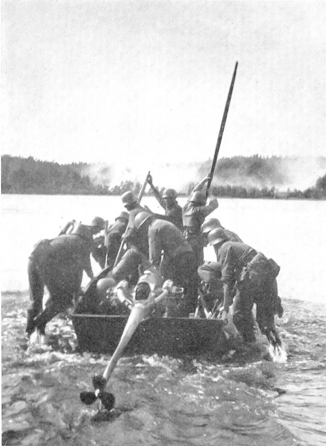
Finnische Infanterie im Gefecht. Im Schutze der Artillerie und der schweren Waffen wird mit Schlauchbooten ein Gewässer überwunden.

Bataillonen, Fliegerabwehr-Bataillonen, Genie- und Nachrichtenkompanien und einer Motorwagen-Kompanie.