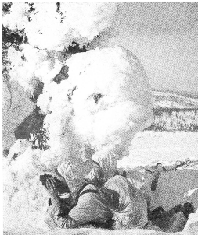
Die Finnen zählen mit Recht zu den besten Skisoldaten der Welt, die sich vor allem im praktischen Kampfeinsatz bewährt haben. Die kleinen und wendigen finnischen Skipatrouillen, die sich über Hunderte von Kilometern weit über die finnisch-russische Grenze wagten, um hinter den Linien der Sowjetarmee Zerstörung und Verwirrung zu stiften, gehören heute zu den besten Beispielen des heldenhaften Widerstandes des finnischen Volkes im harten Winterkrieg.

Die Panzerbrigade besteht aus Panzerschule, Panzerregiment, zwei Jägerbataillonen, unabhängiger Mörserkompanien, Feldartillerie-