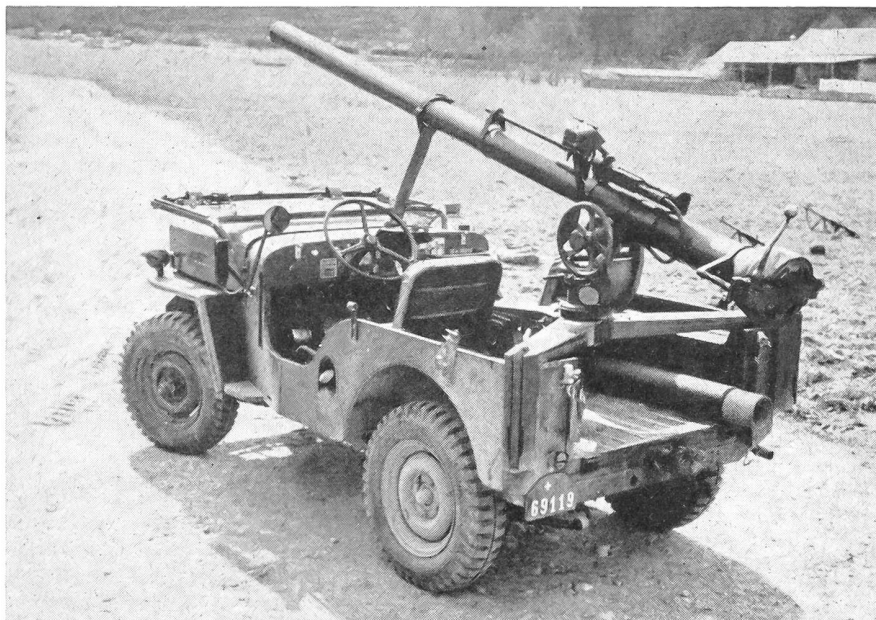
Bat 106 mm

Da wir keine Macht und Möglichkeit besitzen, überhaupt das Losbrechen eines Krieges zu verhindern, müssen wir wenigstens Vorkehrungen treffen, um unser Land in einem Krieg zu schützen.