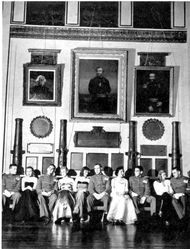
Alle Samstage ist Tanzabend mit jungen Damen aus der Umgebung. ATP