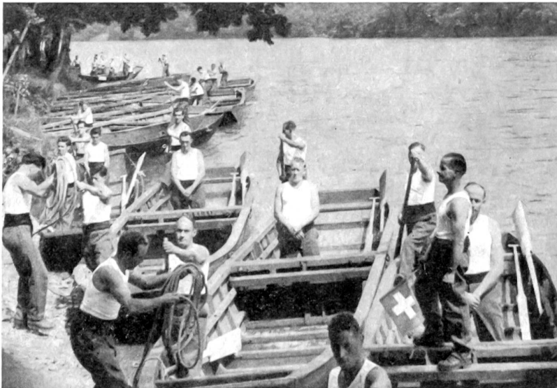
Der Wettkampf beginnt.

Der ruhige Fluß, wie wir ihn im Alltag kennen, kann sich in kürzester Zeit als wütendes Element entpuppen. Flüsse treten über die Ufer, Ueberschwemmungen bringen ganze Talschaften in arge Bedrängnis. Um in solchen Notfällen helfen zu können, besitzt der Schweizerische Pontonierfahrverein eine Hochwasseralarmorganisation, die innerhalb weniger Stunden den Einsatz von Detachementen mit dem