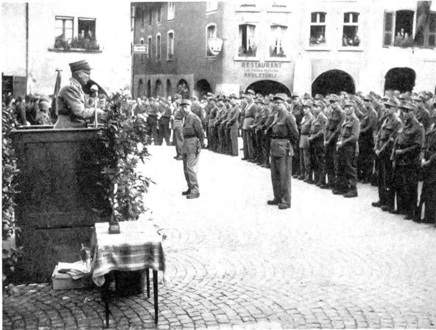
In Thun fand die militärisch schlichte und würdige Rangverkündung auf dem idyllischen Rathausplatz statt. Oberstkorpskommandant Corbat würdigte als Ausbildungschef die Leistungen und sprach den Patrouilleuren Dank und Anerkennung aus