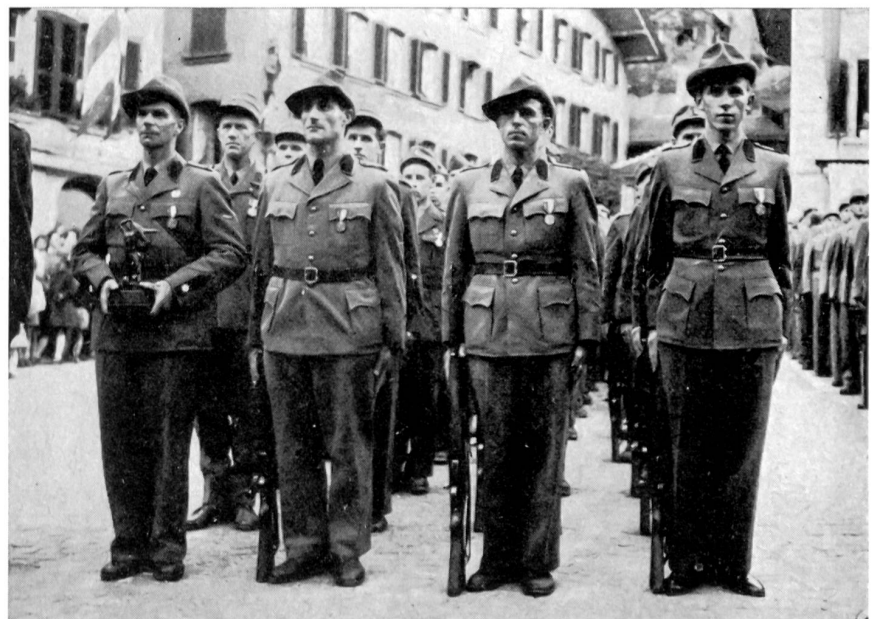
Armeemeister im Sommer-Mannschaftswettkampf wurden 1956 die Grenzwächter. Die läuferisch starke und auch unterwegs mit Waffe und Kopf ihren Mann stellende Patrouille des Grenzwachtkorps III in Chur. Der Patrouillenführer hat den gediegenen Wanderpreis, das Mahnmahl zur Wehrbereitschaft der denkwürdigen Zürcher Landesausstellung, in Empfang genommen

Ein Volk besiegen, heißt es zwingen, auf sein Fleisch zu hören.