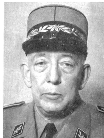
Oberstbrigadier Richard de Blonay

F «Gruppe Frei — durch den Wald — im Schwarm, 5 m Zwischenraum — Nr. 2, 6, 3, 7 Baumbeobachter — marsch!» (Diese Organisation kann auch in gewöhnlicher Umgangssprache besprochen werden; das Kommando löst dann die Aktion aus.)