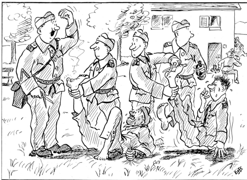
Nach em Divisionswaggel: «Chömed go luege — da hämmer es maximal's Exemplar!»