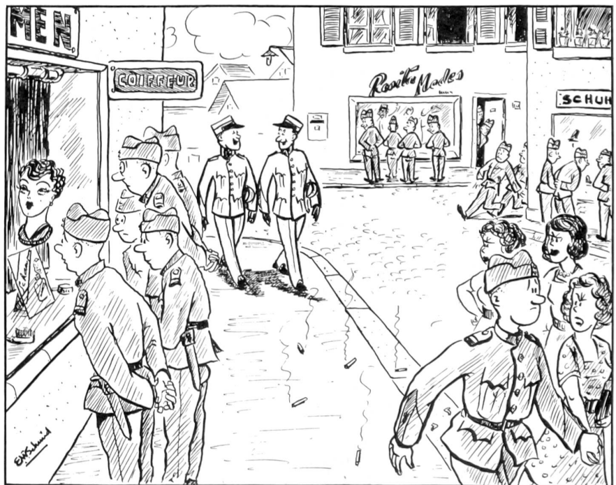
Im Ausgang: Plötzliches Interesse für Schaufenster!