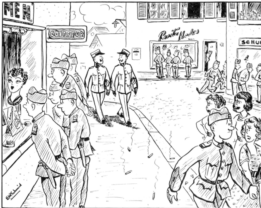
Im Ausgang: Plötzliches Interesse für Schaufenster!