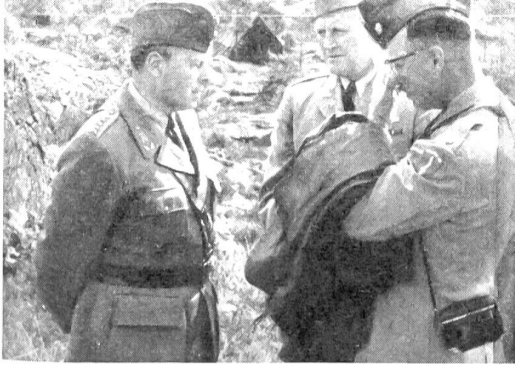
Hier unterhält sich der schwedische Reichsheimwehrchef, Oberst Per Kellin, mit den Vertretern der Nato an den Wettkämpfen.

Ein vorbildlich funktionierender Rechen dienst sorgte dafür, daß die Resultate der einzelnen Disziplinen fortwährend im Barakkenlager des Uebungsgeländes auf großen Wandtafeln angeschrieben wurden.