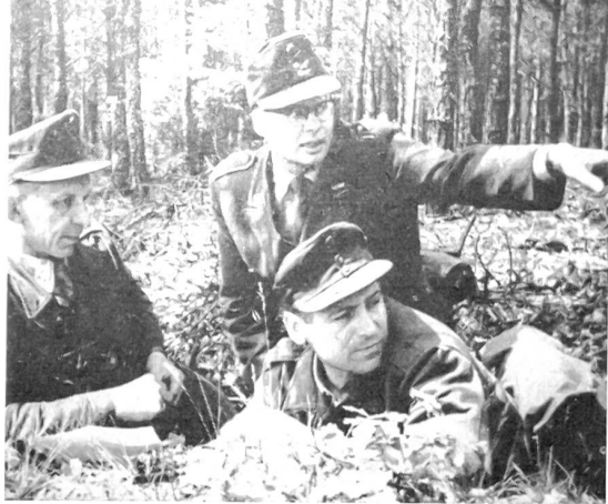
Ein Kompaniechef der Bundeswehr bei der Unterführerausbildung.