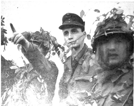
Junger Leutnant der Bundeswehr übt mit seinen Rekruten Geländebeschreibung.

und militärischen Wert abhängig ist. Es gibt kein bürgerliches, und es gibt kein Fürstenheer mehr; es gibt keine Militärkaste mehr und auch keine Leute mehr, die als Kavaliere bereits mit den Sporen an den Stiefeln auf die Welt kommen!