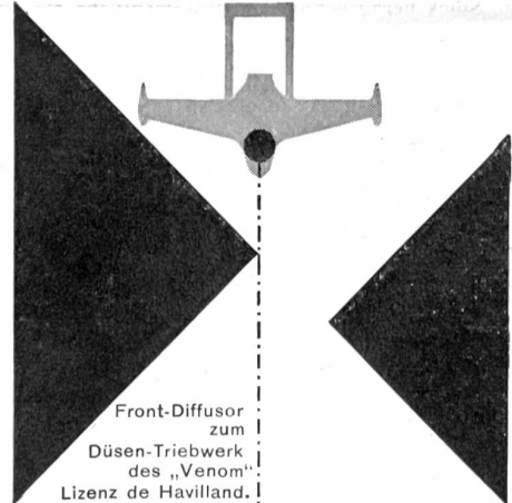
Front-Diffusor zum Düsen-Triebwerk des „Venom“ Lizenz de Havilland.

Leichtmetall guss für Flugzeugbau und Allg. Maschinenbau