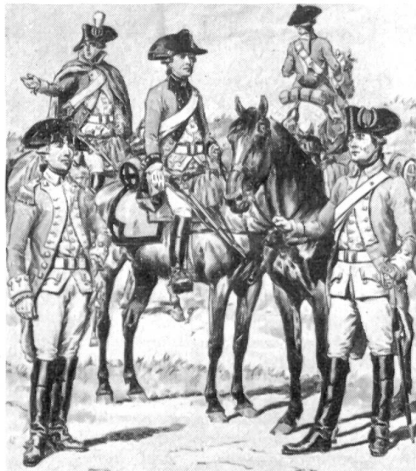
Bern 1768—1785: Dragoner.

Militärische Abzeichen sollen die uniformierte, d. h. gleichmäßig gekleidete Mannschaft voneinander unterscheiden. Je gleichmäßiger sie eingekleidet wird, desto mehr Abzeichen müssen eingeführt werden. Gewiß einigt alle das gleichfarbige Tuch; aber über kurz oder lang, sei es aus Gründen der Ueber- und Unterordnung oder der allgemein menschlichen Selbstbehauptung heraus, ist jeder Uniformierte bestrebt, durch kleine Verschiedenheiten und Abweichungen