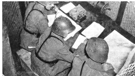
Bereits trifft an der Fernbedienungsstelle der Funkstation die Meldung vom Gefechtsstand ein.

Zum Aufbau, Betrieb und Unterhalt dieses Befehls- und Nachrichtenapparates bedarf es aber auch einer Nachrichtentruppe, in der der letzte Mann fest davon überzeugt ist, daß er nie Selbstzweck ist, sondern immer nur für den Kommandanten die Verbindung aufrechterhält. Neben der Betriebssicherheit des Gerätes ist der Mann, der es bedient, ausschlaggebend für den Erfolg. Die Eigenart des Dienstes der Nachrichtentruppe und die Anforderungen, die an die Selbständigkeit des einzelnen Mannes ohne Kontrolle gestellt sind, erfordern unbedingte Zuverlässigkeit, körperliche Ausdauer, Pflichtgefühl in der Geheimhaltung von Meldungen, geistige Regsamkeit in Verbindung mit dem technischen Verständnis. Es liegt be-