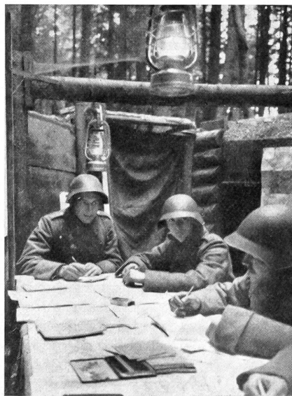
Kaum ist der Kommandoposten eingegraben, hat auch schon die Nachrichtenequipe die Arbeit aufgenommen. Sappeure erstellen erst noch das schützende Dach.

Um eine Verbindung herzustellen, bedarf es neben technischem Können, einer richtigen Beurteilung und Ausnützung des Geländes und nicht zuletzt der Fertigkeit im Gebrauch der Schußwaffe. Wer das elementare technische Verständnis nicht besitzt, geht als technischer Handlanger im Chor der Widerstände unter, und alles andere wird ihm nur zum Schein dienen. Die Aufstellung einer Nachrichtenanlage, die richtige Standortwahl der gesamten Um-techn.-Einrichtung, das frühzeitige Befehlen für den Einsatz der richtigen Übermittlungsmittel, die seriöse Improvisation in Krisenlagen wird der Kommandant nur einem Organ überlassen, das, seine taktische Absicht erkennend, die Mittel selbst fest in der Hand hält. Von Bedeutung ist eine wirklich kontinuierliche Auseinandersetzung mit der Entwicklung der Lage, eine nie abreißende denkerische Durchdringung des Kampferlaufes, um der Führung andauernd durch stete Anpassung des Befehls- und Nachrichtenapparates die Verbindungen sicherzustellen.