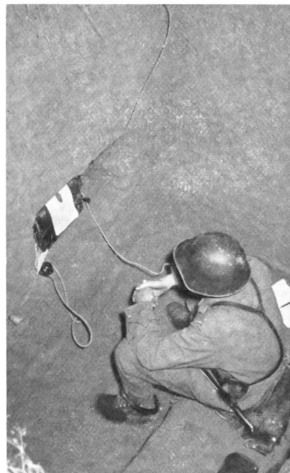
Am andern Ende des Kabels . . . tief eingegraben sitzt der Telefonist des Rgt.-Gefechtsstandes.

1. Der Fernschreiber mit einer Übertragung von etwa 1200 Worten pro Stunde hat als Stabsverbindung den Vorteil, sowohl beim Absender wie auch beim Empfänger ein Dokument zu hinterlassen. Die Übertragung erfolgt über Draht oder auch drahtlos und kann automatisch chiffriert und dechiffriert werden.