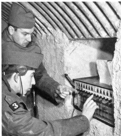
Im festgemauerten Unterstand bildet die Telefonzentrale den Knotenpunkt der Kabelverbindungen zur Front.

Der Verwendungsbereich von Fernschreiber, Fernzeichner und Fernsehen, als persönliche Kommandanten- oder als Stabsverbindung eingesetzt, sei kurz noch näher illustriert.