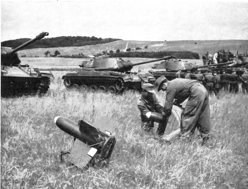
Raketen jagen Panzer. Französische Raketen vom Typ SS 10. Die Reichweite der 15 Kiloschweren Raketen beträgt bis zu 1600 Meter, bei einer Geschwindigkeit von etwa 360 Stundenkilometern. Ein Knopfdruck des Kanoniers, der bis zu 150 Meter von der Rakete entfernt sein kann, löst den Abschub aus.

«Der Drill ist», antwortete der Oberst mit ernstem Gesicht, «unbedingt erforderlich, um die Truppe jederzeit bei der Kandare zu halten. Im Exerzierreglement der Roten Armee steht zwar neuerdings die Weisung, daß dem Paradeschritt sowie natürlich auch dem Präsentiergriff keine allzu große Bedeutung mehr zugemessen werden solle. Mit anderen Worten: Der Verteidigungsminister will es nicht haben, daß mit solchen und ähnlichen Nebensächlichkeiten viel Zeit verlorengeht. Der Begriff jener Weisung ist indes dehnbar. Jedem Einheitskommandanten steht ein gewisser Spielraum für sein eigenes Ermessen zur Verfügung. Und das ist gut so. Nicht nur das geregelte und enge Zusammenleben in der Kaserne schweißt die jungen Leute zu einer festen Gemeinschaft zusammen, son-