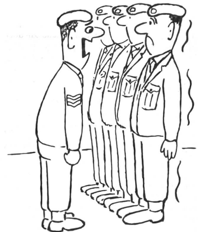
«Wer gab Ihnen Erlaubnis zu zittern?!» (Aus «Soldier»)