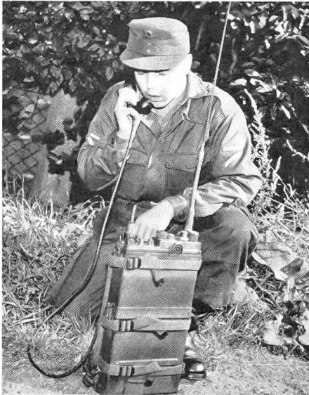
UKW-Sprechfunkgerät mit Sichtverbindung.