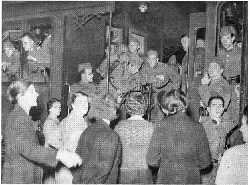
Vor zwanzig Jahren