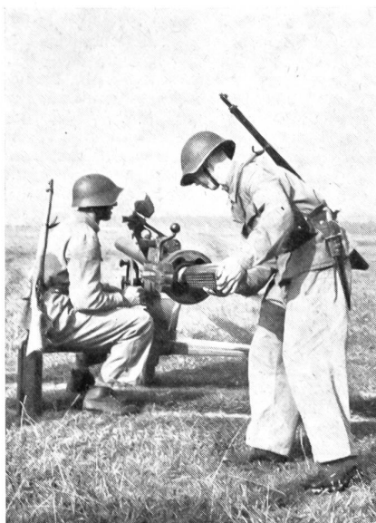
Unser Bild zeigt das Einschleiben des Geschosses in die BAT.

Erstmals wurden Wehrmänner in der Handhabung und im feldmäßigen Einsatz des neuen, rückstoßfreien Panzerabwehrgeschützes Typ BAT (Provenienz: USA) ausgebildet. Das Geschütz besitzt Treffsicherheit auf 1500 bis 2000 m Distanz und wiegt rund 250 kg.