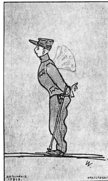
Ein liebes Kerlchen

Aber auch hier muß die Planung über die Durchführung dieses Kampfes vorausgehen. Sie muß heute schon beginnen, wenn Ihre Bemühungen bis Ende des nächsten Jahres von Erfolg gekrönt sein sollen. Gerade die Wintermonate sind die beste Zeit für diese