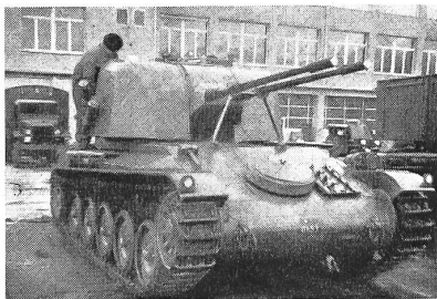
Der Flabpanzer der Firma Hispano Suiza

Auch die rasche Entwicklung der Luftabwehr-rakete kann den Flabpanzer nicht verdrängen, wenn sie auch nachhaltig auf seine Gestaltung einwirken wird.