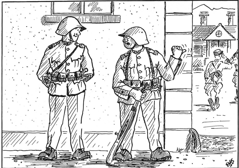
Umschulungskurs: «Vor zweiezwanzgg Jahre i de R. S. hämmer au ordli G'wergriff g'macht — aber Gopjridstutz, i so-mene Kurs da — allpot chunnt eine z'laufe — sitdem ich daachtande isch säb de zweievierzgischtl!»