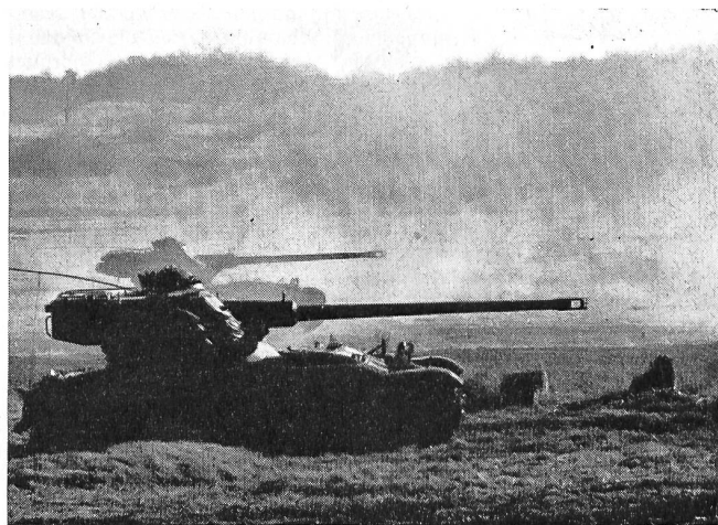
Die Panzer französischer Herkunft vom Typ AM-X gehören, nachdem sie bereits in der Schweiz und in Schweden mit Erfolg eingeführt wurden, auch zur Ausrüstung der Panzertruppen des österreichischen Bundesheeres.