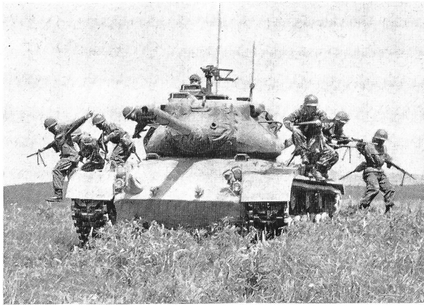
Die Zusammenarbeit zwischen Panzern und Infanterie gehört im Bundesheer zum wichtigsten Bestandteil der Gefechtsausbildung, die immer wieder in allen nur möglichen Situationen geübt wird.