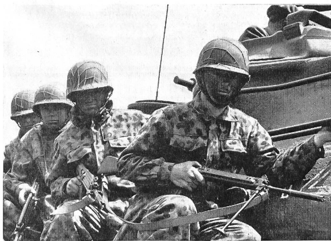
Die Schwärzung der Gesichter gehört nicht nur im österreichischen Bundesheer, sondern in allen modernen Armeen zu den Maßnahmen der Tarnung. Mit einer Spezialpaste aufgetragen, soll diese Tarnung auch gegen Hitze- und Strahlungsschäden schützen.

Die Durchführung der hiezu benötigten Operationen stellte an Truppen und Material ungeheure Anforderungen. Dies um so mehr, als das Gelände den Einsatz von Fahrzeugen nicht zuließ. Ausrüstung, Nachschub, schwere Infanteriewaffen usw. mußten durch Trägerkolonnen oder Tragtiere über die steilen Pässe getragen werden. Die Ausgangslage war folgende. Die Bereitstellung für die 6. Gebirgsbrigade, den sogenannten «Blauen», erfolgte bei strömendem Regen und daher verschlammten Wegen in der Wildschönau. Von dort stiegen die Kompanien auf einen fast 2000 Meter hohen Gebirgsrücken. Obwohl eine Tragtierkompanie die schwersten Lasten beförderte, waren die Anforderungen an die Mannschaften enorm, wenn man bedenkt, daß außer den schweren Rucksäcken unter anderem auch Granatwerfer und Munition mitgetragen wurde. Erschwerend wirkte ein auf den Höhen wütender, orkanartiger Schneesturm. In dem fast 80 Zentimeter hohen Neuschnee stießen die «Blauen» das erste Mal auf den Feind. Da in der Nacht hier nichts zu wollen war, wurde durchnäßt und frierend Stellung bezogen. Bei dem für fünf Uhr früh festgesetzten Angriff fegten die «Blauen», alle durchstandenen Strapazen vergessend, den Feind