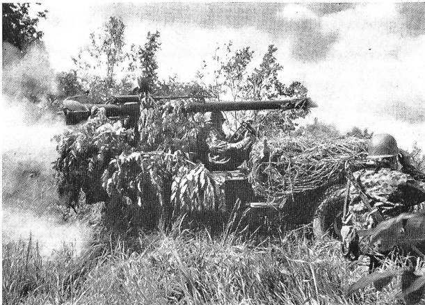
«Tarnung» wird im Bundesheer ganz groß geschrieben, und die realistische Gefechtsausbildung im blinden und scharfen Schuß trägt den Forderungen einer kriegsgenügenden Ausbildung unerbittlich Rechnung.

ganze Truppenteile waren in den Gebirgstälern abgeschnitten. Der Einsatz der Truppen für die Aufräumungsarbeiten wurde vom ebenfalls abgeschnittenen Brigadekommando über den Funkweg geleitet.