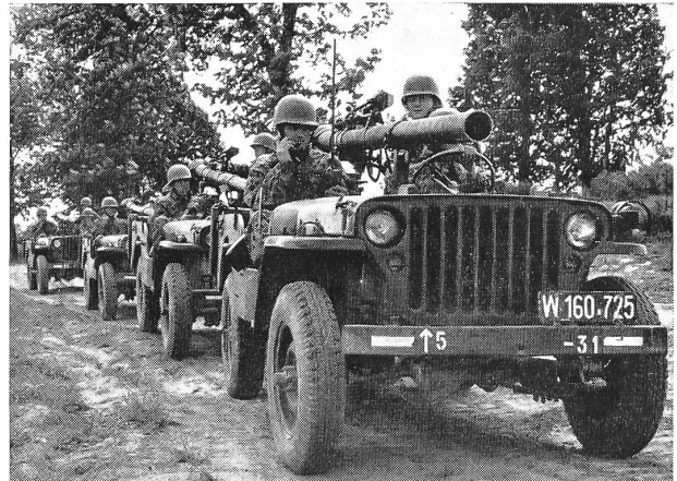
Im österreichischen Bundesheer, das wie die Armeen anderer neutraler Kleinstaaten nicht alles besitzen kann, was nur wünschenswert ist und sich ökonomisch nach der Decke des Notwendigen und wirtschaftlich Tragbaren strecken muß, wird aber der aktiven Panzerabwehr auf allen Ebenen größte Bedeutung beigemessen. Hier eine Kampfgruppe mit rückstoßfreien Geschützen amerikanischer Bauart.