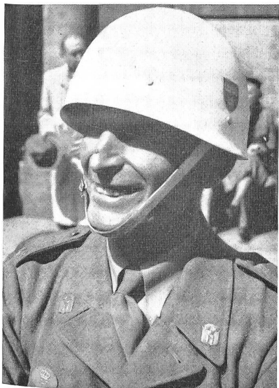
Heimwehmann der königlichen Wache in Stockholm.

Schließlich ist noch etwas zu erwähnen: die Heimwehrlente sind keine Greise. Etwa 70 Prozent sämtlicher eingeschriebenen Heimwehrmänner stehen im Alter von weni-