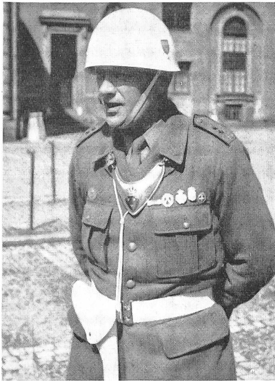
Das ist ein Heimwehroffizier, der Chef vom Dienst, dafür mit einem besonderen Brustschild bezeichnet.

Fähigkeit, andere Aufgaben zu lösen, hängt ab von Art und Anzahl der in Friedenszeiten abgehaltenen Übungen. Nur Übung verleiht Fertigkeit, und da ja die Zugehörigkeit zur Heimwehr auf Freiwilligkeit beruht, hängt die Teilnahme an Übungen, die über das Obligatorische hinausgehen, weitgehend davon ab, wie sie aufgezogen sind und welche Instruktionen zur Verfügung stehen. Der Wehrpflichtige, besonders der zum Offizier oder Unteroffizier ausgebildete, kann Wertvolles leisten für die Hebung der Tüchtigkeit der Heimwehr, indem er den Stäben der Verteidigungsbezirke und den Heimwehrkommandanten behilflich ist bei der Durchführung der Übungen, die an Sonntagen für Heimwehrlente abgehalten werden.