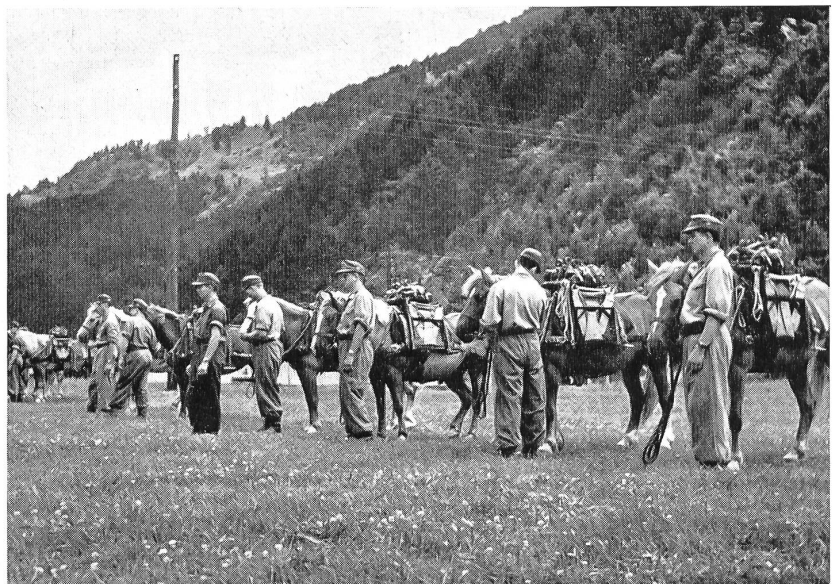
Ein Tragtier-Detachement des österreichischen Bundesheeres

In der Schweiz herrscht gegenwärtig die Meinung vor, in einer neuen Truppenordnung müßten die Pferde in einer selbstän-