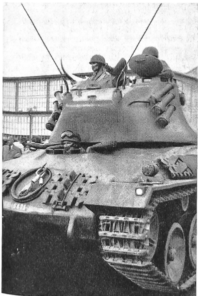
Der Pz. 58 anlässlich der Pressevorführung in Thun

Der Panzer zeichnet sich vorab durch eine bei seiner Stärke auffallend günstige Silhouette aus und bietet daher mit seinen fließenden Linien weniger Angriffsfläche als der Centurion, obwohl seine Bewaffnung und Panzerung als gleichwertig zu bezeichnen ist. Wanne und Turm sind aus Stahl gegossen und bieten einer Besatzung von vier Mann genügend Raum. Die Bewaffnung besteht aus einer 9-cm-Kanone, einemrohrparallelen Schnellfeuergeschütz von 20 mm Kaliber und einem Maschinengewehr für die Nahverteidigung. Bei einer maximalen Geschwindigkeit von 50 Stundenkilometern beträgt das Gefechtsgewicht 35 Tonnen, während der Panzer eine Länge von 655 cm, eine Breite von 302 cm und eine Höhe von 265 cm aufweist. Die maximale, an der Demonstration bewiesene Steigfähigkeit, beträgt 70 Prozent, während Hindernisse bis zu 75 cm Höhe überklettert, Gräben und Bäche bis 280 cm Breite über-