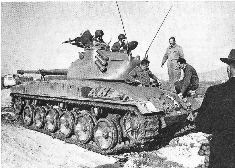
Bundesrat Chaudet als Panzerfahrer. Der Chef des EMD hat sich in Thun selbst von den guten Eigenschaften des Pz. 58 überzeugt, um sich bei einer Fahrprobe auch über die guten Lenk- und Fahreigenschaften zu vergewissern

In der Eigenentwicklung wurde nach einem Panzer gesucht, der in der Tonnage zwischen den 15 Tonnen des AMX und dem Centurion mit seinen 50 Tonnen liegt, mit seinen Kampfeigenschaften aber die Qualitäten eines mittelschweren Panzers erreicht. In enger Zusammenarbeit zwischen den Eidgenössischen Konstruktionswerkstät-