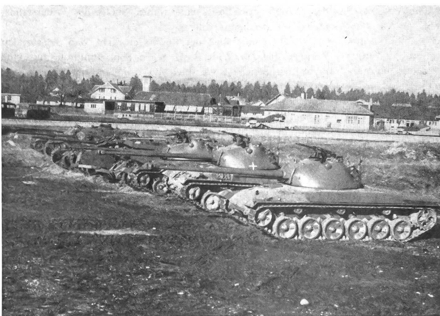
Kampfwagen unserer Armee Von rechts: 3 Panzer 58, 2 AMX und 1 Centurion ATP

Wenn wir einerseits die Landwehr von Preußen übernommen haben, so hat uns dieses andererseits den «Landsturm» zu verdanken. Sache und Wort sind schweizerischen Ursprungs und mögen in Berlin erst durch Schillers «Wilhelm Tell» bekanntgeworden sein, just zur Zeit der Franzosenherrschaft. In der Rütli Szene sagt Walter Fürst vorausschauend: «Wenn am bestimmten Tag die Burgen fallen, so geben wir von einem Berg zum andern das Zeichen mit dem Rauch; der Land-