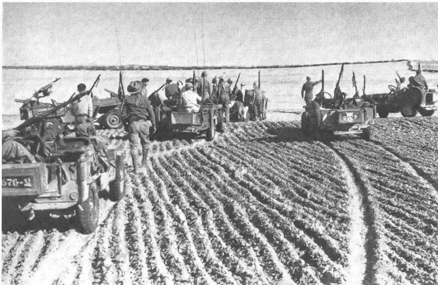
Die siegreiche Jeep-Gruppe im Gaza-Streifen, Dezember 1948.

strategisch wichtigen Kastell, wurde bitter und heftig gekämpft, und die Befestigungen wechselten einige Male ihre Besitzer. Noch während des Kampfes fuhr der erste große Konvoi nach Jerusalem, wobei zum erstenmal ein Aufklärungsflugzeug eingesetzt wurde.