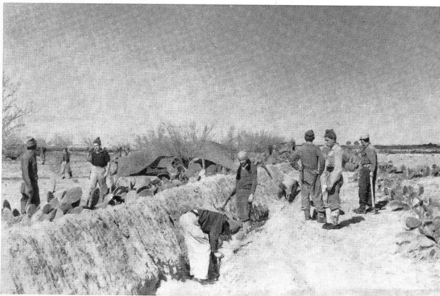
Schützengrabenbau an sehr exponiertem Posten im Negev. Ende 1948.

Die Lage in Jerusalem, welches von der Küste abgeschnitten war, verschlechterte sich zusehends. Die Reserven, welche zur Verfügung standen, wurden immer kleiner. Besonders groß war der Mangel an Nahrung, Wasser, Pharmazeutika und Munition. Der Fall von Jerusalem wäre wohl das Ende des Jischuws gewesen.