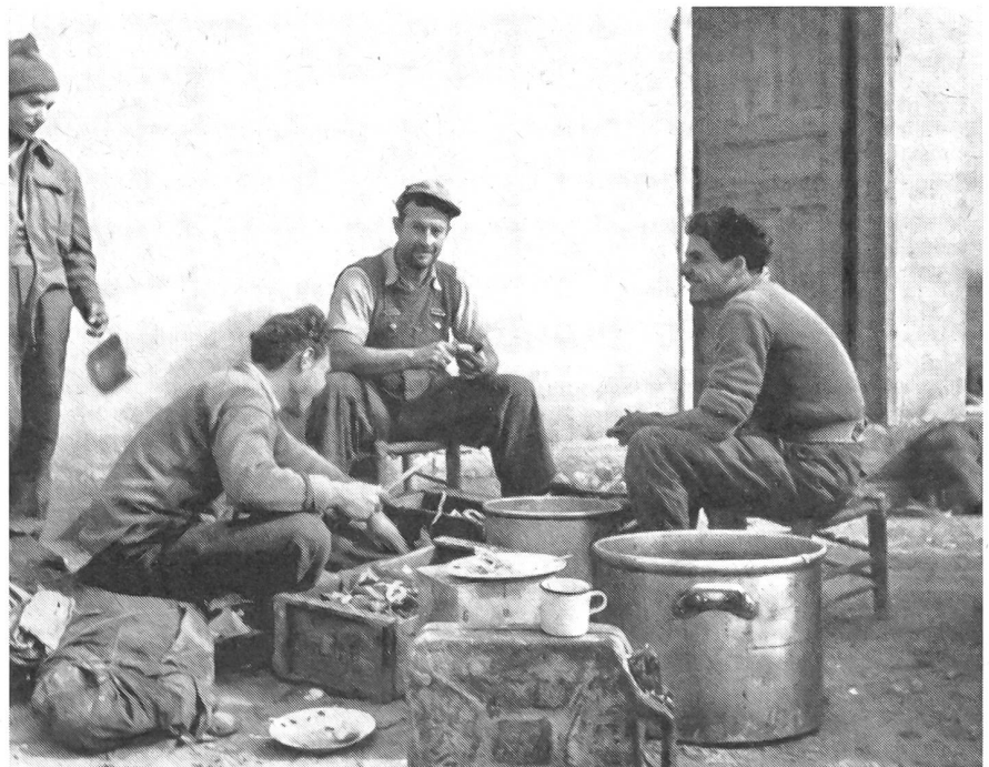
Feldküche einer Füsilierkompanie im Galil

Den Arabern standen große Mengen leichter Waffen zur Verfügung, außerdem arbeiteten für die Araber auch britische Deserteure und Mineure und Instruktionsoffiziere der ehemaligen Nazi-Wehrmacht.