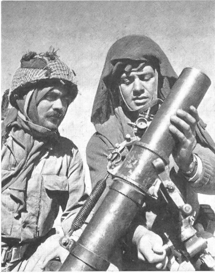
Einsatz eines Mörsers im Befreiungskampf, Dezember 1948.

verwirklicht: Aufhebung des englischen Mandates und Teilung in einen jüdischen und einen arabischen Staat. Als letztes Datum für die Mandatsbeendigung wurde der 1. Mai 1948 festgelegt.