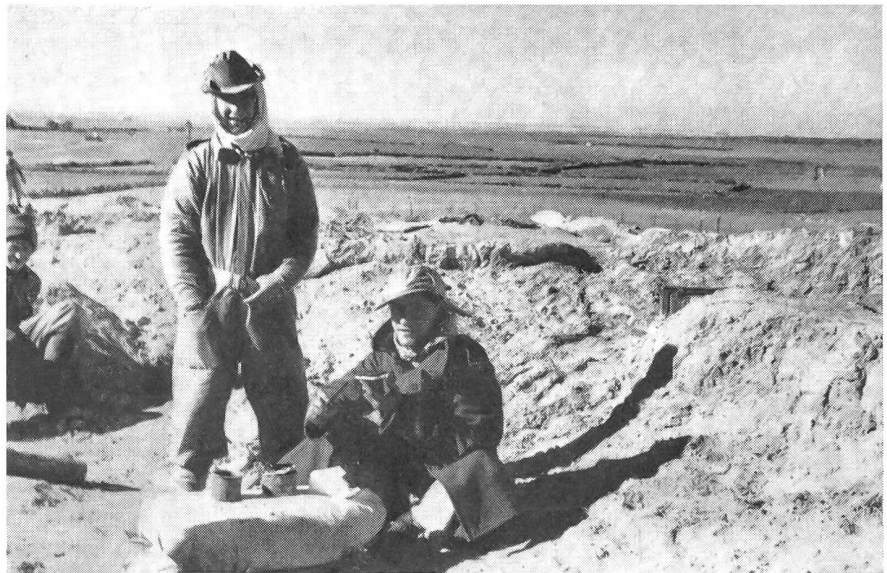
Mahlzeit im Negev

Aber die Araber wolten diesmal den Waffenstillstand zu ihren Zwecken ausnützen und ihn brechen, wann und wo es ihnen recht war. Nach einigen Monaten relativer