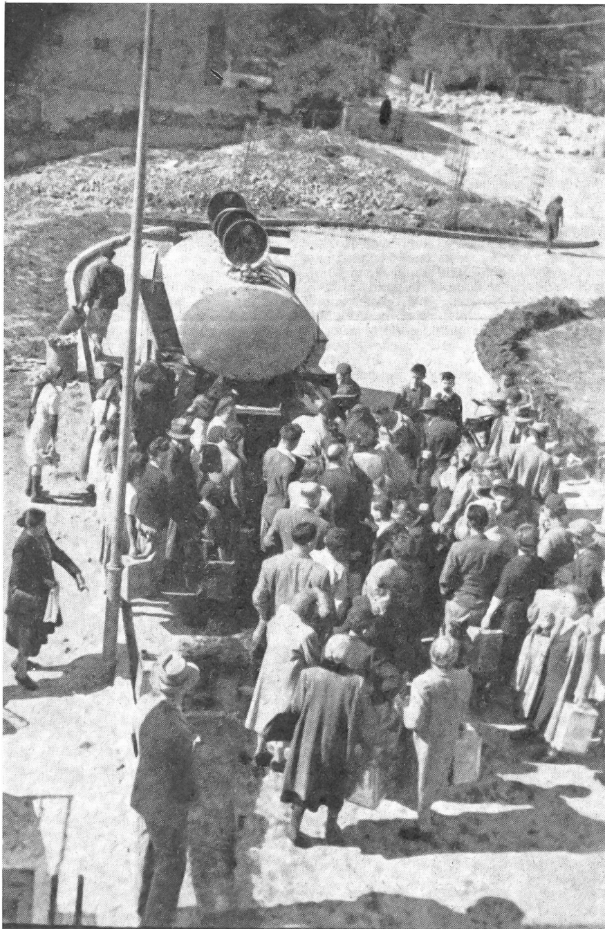
Öltank im belagerten Jerusalem, wo die Bevölkerung ihre Brennstoffzuteilung abholt. Erste Phase des Befreiungskampfes, als die Araber alle Zufahrtswege abgeschnitten hatten

Diese Informationen über die Verteidigungsarmee Israels entnahmen wir einem Artikel von Hans-Armin Reinartz «Die Israel-Armee — Verteidigungsinstrument gegen zwanzigfache Übermacht» (Wehrwissenschaftliche Rundschau, Heft 8, 1960). Ferner der Schrift «The Israel Defence Forces» von Sgan-Aluf Shaul Ramati, Jerusalem, 1958.