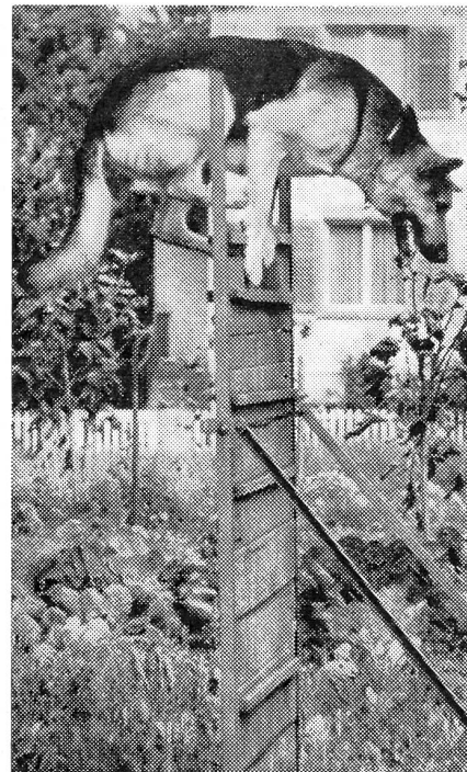
Deutscher Schäfer an der 1,8 m hohen Kletterwand

Als Vergleich zur Dienstleistung der Wehrmänner diene folgende Berechnung: 1 Hunde-Jahr = 7 Menschenjahre! Die Einteilung, der mindestens eine Prüfung in der Schutzhund-Klasse II mit Ausbildungskennzeichen vorangegangen sein muß, kann also mit etwas über 10 Menschenjahren erfolgen,