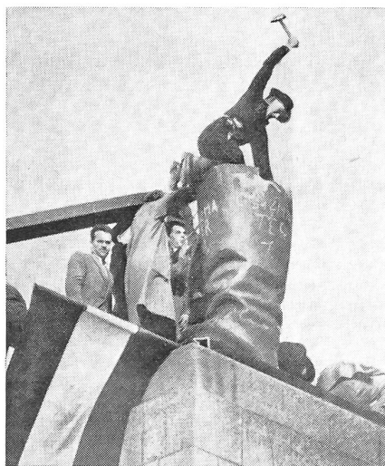
Die erbitterte Arbeiterschaft war es, die das große Stalinendenkmal in Budapest umlegte und hier dabei ist, auch die Bronzestiefel des kommunistischen Diktators in Stücke zu schlagen.