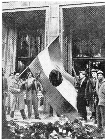
Sichel und Hammer, das verhaßte kommunistische Symbol der Unfreiheit, wurde von den Freiheitskämpfern aus den ungarischen Fahnen gerissen.