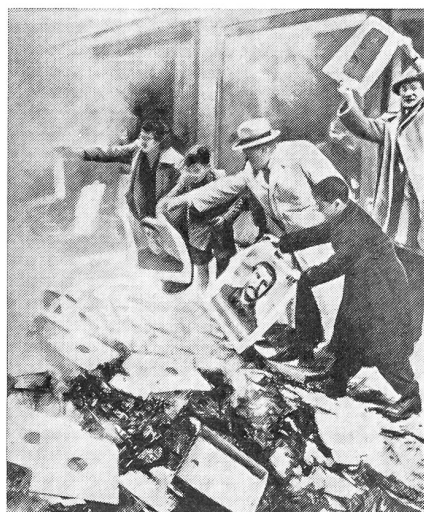
Die verhaßten Bilder und Bücher, Tonnen von kommunistischem Propagandamaterial wurden verbrannt, während sich das Volk in den ersten Strahlen der jungen Freiheit sonnte, die Moskau nach der Untätigkeit der freien Welt so blutig zusammenschlug.