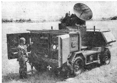
Die zu je einer Batterie des Oerlikoner-Zwillingsgeschützes gehörende «Superfledermaus», ein Feuerleitgerät, das die Batterie zu einer automatischen radargesteuerten Mittelkaliber-Flabbatterie macht.